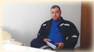
Șeful pompierilor Recaș

Deja au început cursurile de servanț pompier, care îi ajută pe voluntari și pe cei care vor să devină pompieri voluntari să înțeleagă mai bine rolul pe care îl are această ocupație. „Proiectul este foarte important pentru orașul Recaș și pentru toți cetățenii, dar și pentru noi,