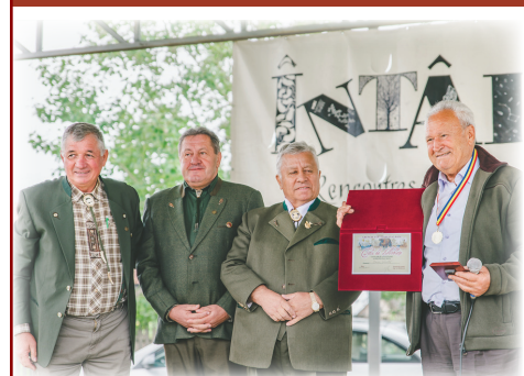
Edilul comunei Bata – primul din stânga imaginii - alături de primarul comunei noastre