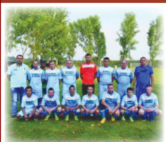
A.S.F.O. Sânpetru German